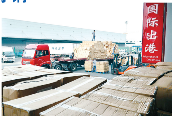
郑州机场货站卸货区一片繁忙(资料图片)