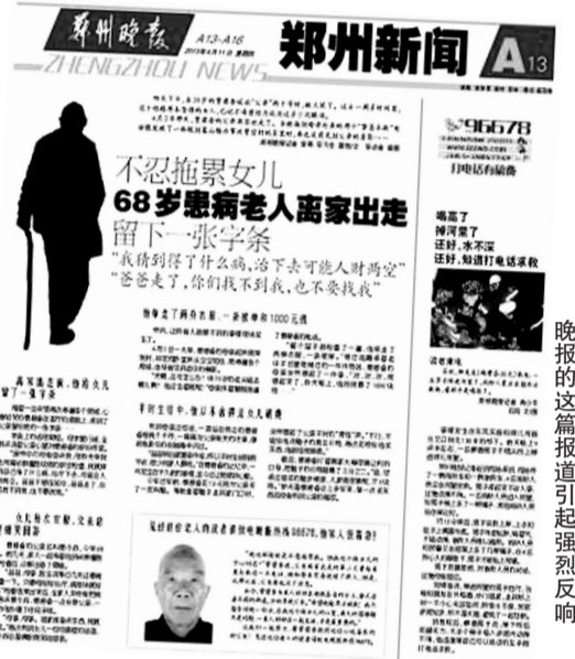
晚报的这篇报道引起强烈反响