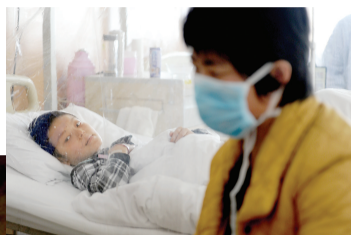
看着孩子写的信,母亲心如刀割。