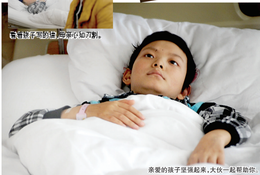
亲爱的孩子坚强起来,大伙一起帮助你。