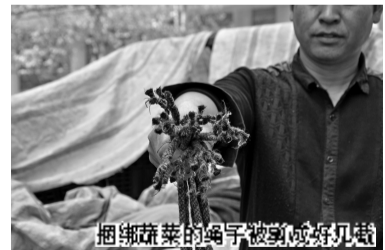
捆绑蔬菜的绳子被剪断,好少见