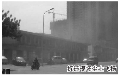
拆迁现场尘土飞扬

微爆料“城中村”拆迁了,城市发展了,可是一些麻烦也产生了。昨日下午,网友@东方红-001(稿费30元)吐槽,“城中村”拆迁,造成灰尘满天飞,令居民们苦不堪言,希望引起有关部门的重视。