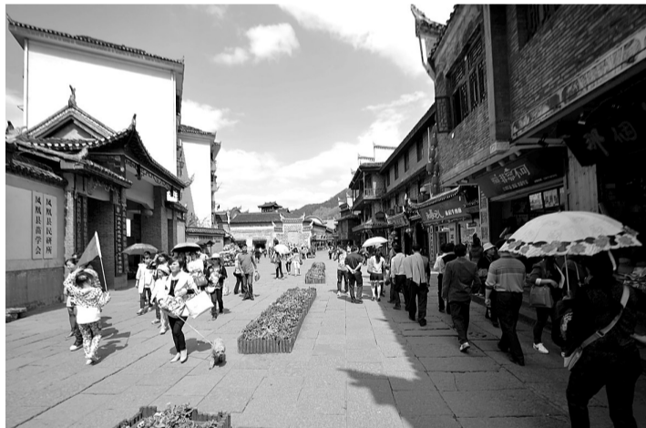
4月13日,游客们进入凤凰古城游览。

4月12日14时至17时,凤凰县政府与100多家客栈的老板举行座谈会。会上,客栈老板提出散客减少、没有生意的问题,政府方面表示,政府在15个工作日内解决。