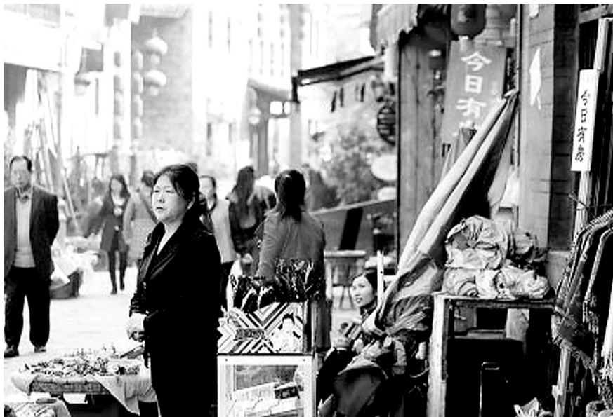
古城内一名旅店老板在期盼游客入住

13日,湖南凤凰县回应售票谋利,该县常务副县长赵海峰称,新政出台必然带来阵痛,必须毅然选择改革。政府应该扮演好角色,帮助客栈、农家船主等利益损失群体渡过难关。