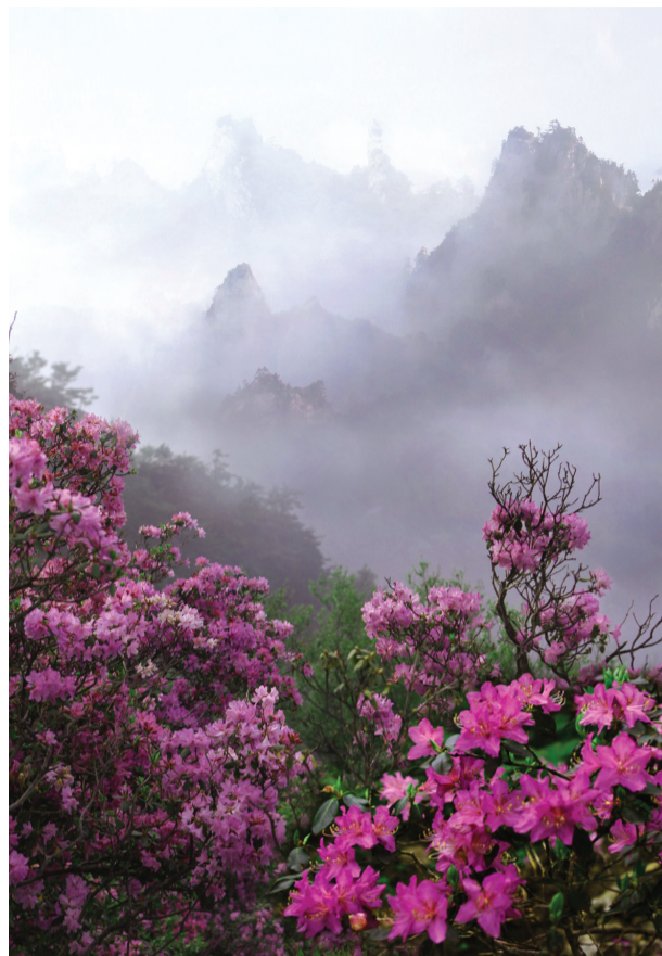
尧山杜鹃

详情请登录: http://www.yaoshanly.com 旅游热线: 0375-5767999、5760999