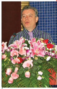
意大利设计大师毕达宁参加论坛。

东易力天装饰还在国内率先成立了“原创设计研究院”,签约国内外设计专家。极易原创设计研究院与意大利、德国、美国等国家顶尖设计机构进行合作,达成多项战略合作意向,共同开发国内外高端设计和装饰市场。东易力天装饰极易原创设计,立足中原,为私家别墅、豪宅、商端会所、大型精工装、样板间等提供高端设计与装修服务。