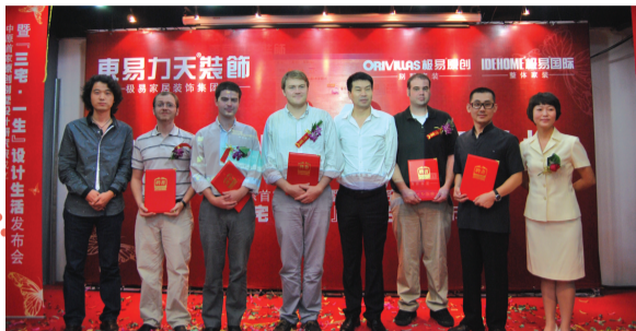
原创设计研究院签约外籍设计师。

作为中国高端设计的领导品牌,东易力天在中国别墅、豪宅设计上一直紧跟国际潮流、不断创新。从2005年起,先后主办过十几届全球家装流行趋势发布会及中国别墅论坛,邀请了意大利、德国、西班牙、法国、美国、日本等国外设计大师及国内顶尖别墅专家参与活动,共同探讨中国高端设计。随着每届活动的成功举办,已发展成为中原房产及家装界的盛事,每次活动都备受业界关注。