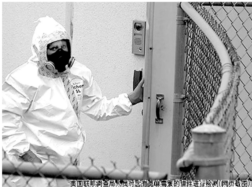
美国联邦调查局人员对含有蓖麻毒素的信件进行检测(网页截图)

美国联邦调查局说,初步检测结果显示,可疑信件中含有蓖麻毒素。美国联邦调查局(FBI)17日逮捕投毒男子。