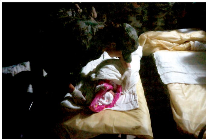
22日晚9时28分56秒,在芦山县人民医院移动手术车上,顺产了一健康女婴,这是雅安地震后在震中心芦山县人民医院诞生的第一个地震宝宝,分娩过程由三家救援医院合作完成。