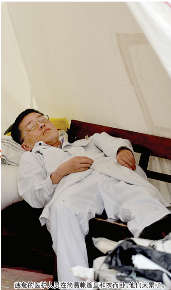
疲惫的医护人员在简易帐篷里和衣而卧,他们太累了。

22日,雅安地震第三天。下午两点多,芦山县人民医院,一条不足十米的小道,接伤员,救治,接伤员,救治……不断地有来自全县的伤员送过来,几乎几分钟一个人。