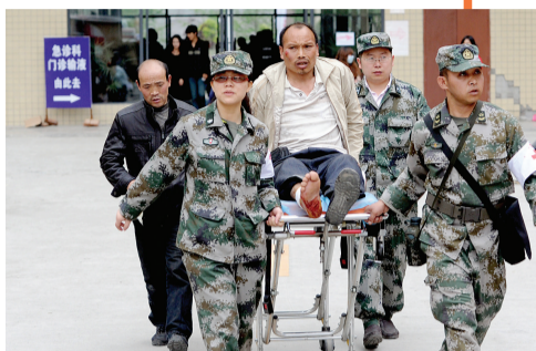
一名刚刚救出的伤员被送到芦山县人民医院。