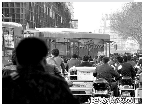
北环文化路交叉回