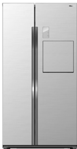
海信博纳系列冰箱表现抢眼

笔者从家电市场获悉,此次全新亮相的新品中,博纳系列BCD-642WVBP/T对开门冰箱表现尤为抢眼,其技术与时尚结合的设计理念,一经面世即吸引了消费者的眼球,令人叹为观止。BCD-642WVBP/T的机身是硬朗的金属外观,深得德国DESIGNETS设计理念的精华,采用目前最尖端的制作工艺,在耐久性