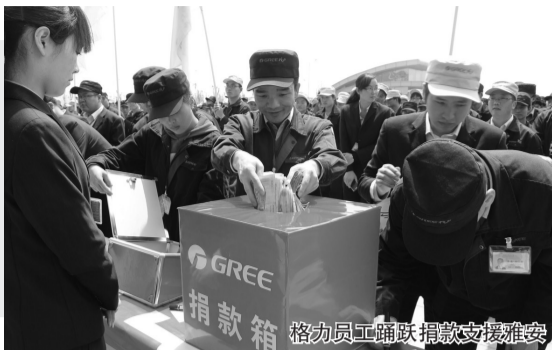
格力员工踊跃捐款支援雅安