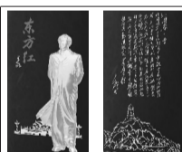
描金雕:伟人故居韶山冲、遵义会议旧址、延安宝塔山、天安门四座伟大建筑见证了主席从农家子弟逐步走向共和国领袖的光辉历程,激励亿万华夏儿女。