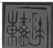
底部印文为邓散木刻“毛泽东”