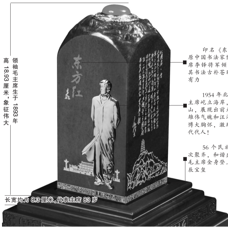
领袖毛主席生于 1893 年,高 18.93 厘米,象征伟大

中国人民革命军事博物馆权威监制 国家宝玉石检测中心逐一鉴定并备案 确保每尊真正和田玉