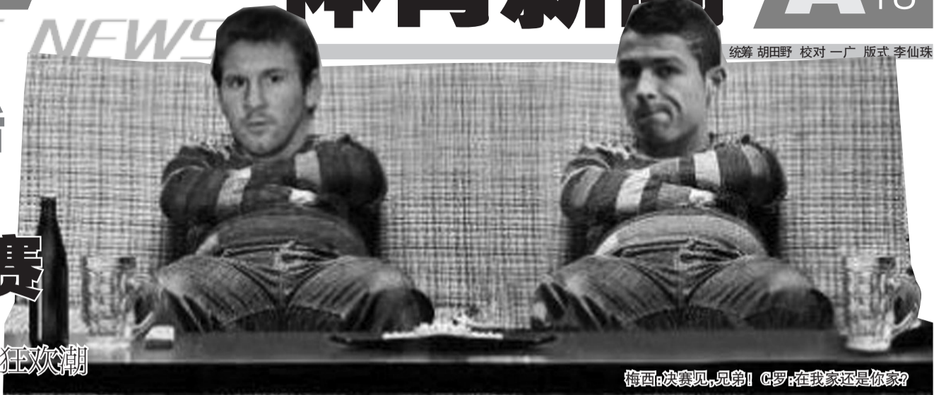
梅西,决赛见,兄弟! C罗,在我家还是你家?

其实,欧冠这两场半决赛并非只是“血案”,还是经典段子的发酵床。说白了,这是欧洲人的比赛,我们就跟着看一看热闹,于是乎,当两场半决赛打完,这两天中国网友和欧洲网友们又集中展现了吐槽的本事——一句话——没有最搞笑只有更搞笑。