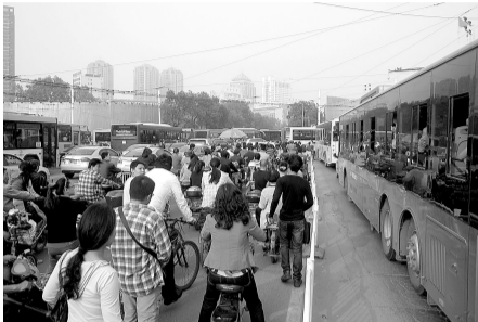
正兴街福寿街口