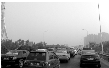
世纪欢乐园中州大道段