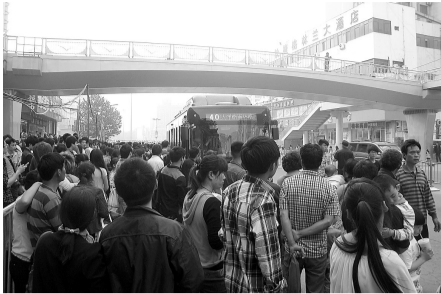
一马路公交站点