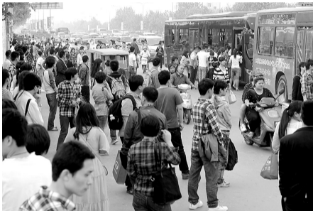
花园路刘庄路口