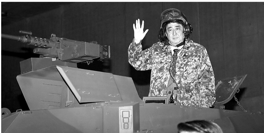
据日本新华侨报网报道，日本首相安倍晋三4月27日出现在千叶市的网络爱好者集会上。他身穿迷彩服头戴钢盔登上展出中的日本陆上自卫队最新型战车，向到场的网民进行选举宣传。

4月30日下午，中国驻美大使崔天凯专门就29日美国防部长哈格尔与日本防卫相小野寺五典会晤时对钓鱼岛问题的表态进行了回应。崔大使表示：“在钓鱼岛问题上，挑起紧张局势、加剧紧张局势的是日本方面，采取所谓单方面或胁迫性行动的也是日本。”对于美方在钓鱼岛问题上的表态，崔大使说：“我们希望，其他方面不要去搬日本这块石头，而让日本这块石头砸了自己的脚。”