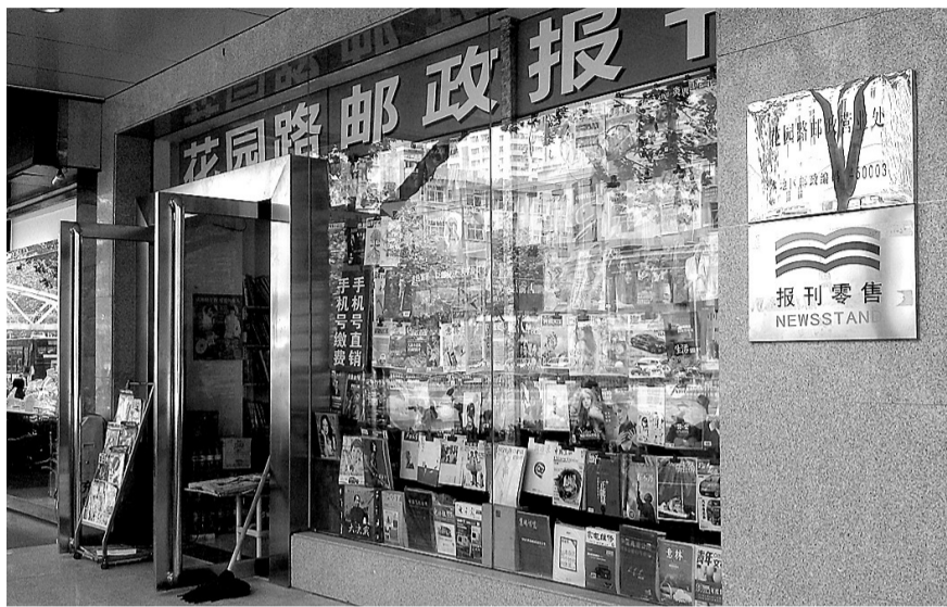
设在花园路的邮政报刊销售门店,报刊品种非常丰富。