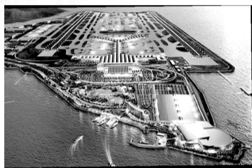
香港机场 航天城 一期