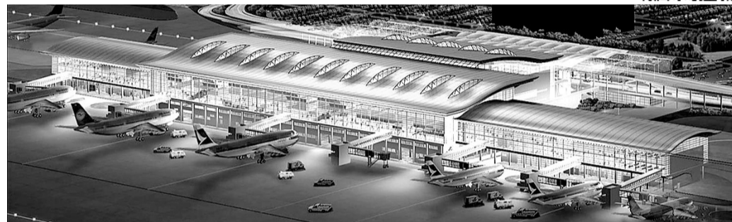
海德拉巴的拉吉夫·甘地国际机场