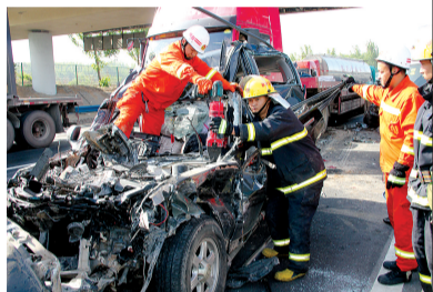
抢险救援队员对变形车辆进行扩张、破拆

大约又行驶了100米,在第五个车祸现场,发现两辆大货车将两辆小轿车挤压在中间,前方的小轿车车头冲进了大货车尾部的底盘下,小轿车内两名人员被困驾驶室。中队指战员协调一辆拖挂车进行牵引救援,将轿车从大货车底盘下拖出来进行施救。对变形驾驶室进行扩张、破拆,最终救出两名被困者,其中一名被困者伤势过重,抢救无效死亡。