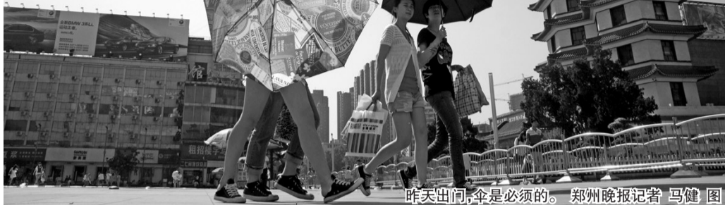
昨天出门,伞是必须的。