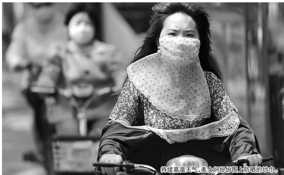
持续高温天气,美女们纷纷围上防晒的纱巾。