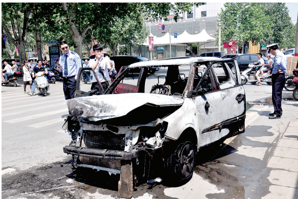
斯柯达轿车被烧成一个骨架