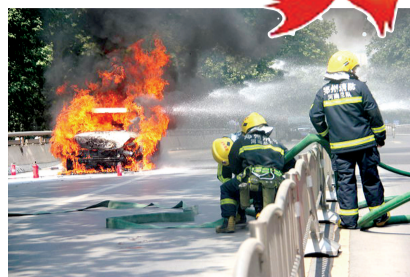
消防官兵准备施救