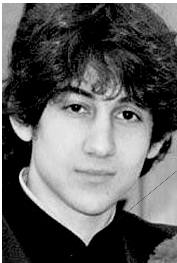
波士顿爆炸案嫌犯焦哈尔