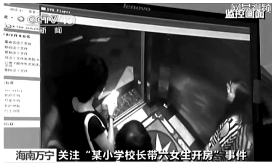
海南万宁关注“某小学校长带六女生开房”事件