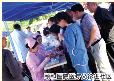
颐和医院医疗义诊进社区

当天上午9时许,活动现场人头攒动,心血管内科、消化内科、呼吸内科、神经内科、儿科、妇科、乳腺外科、骨科、整形外科的专家们身边已经人潮拥挤,并为前来咨询的居民进行了测血压、测血糖、身高、体重等免费检查,并为每一位就诊居民做好了就诊记录,医护人员还派发了健康科普资料、社区家庭医生周刊,还向居民讲解了一些日常的健康知识和自我保健的方法。在义诊进行的同时,颐和医院的专家们还在绿地社区二楼为居民们免费讲授健康知识讲座。