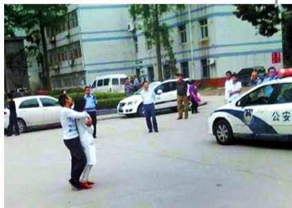
陈某劫持人质和警方对峙。