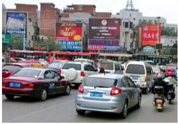
由于信号灯停电,路口交通瘫痪。