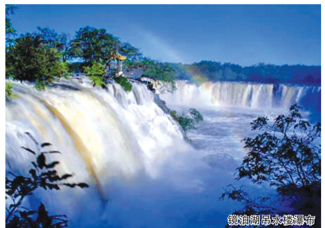
镜泊湖吊水楼瀑布

6月东北草绿花开，生机盎然，河南中旅闯关东全城热卖！65582187热线频频占线，据介绍，“专列除了一票往返，方便、快捷、安全的优势外，大旅行社的品牌效应和好产品更是吸引眼球的关键”。