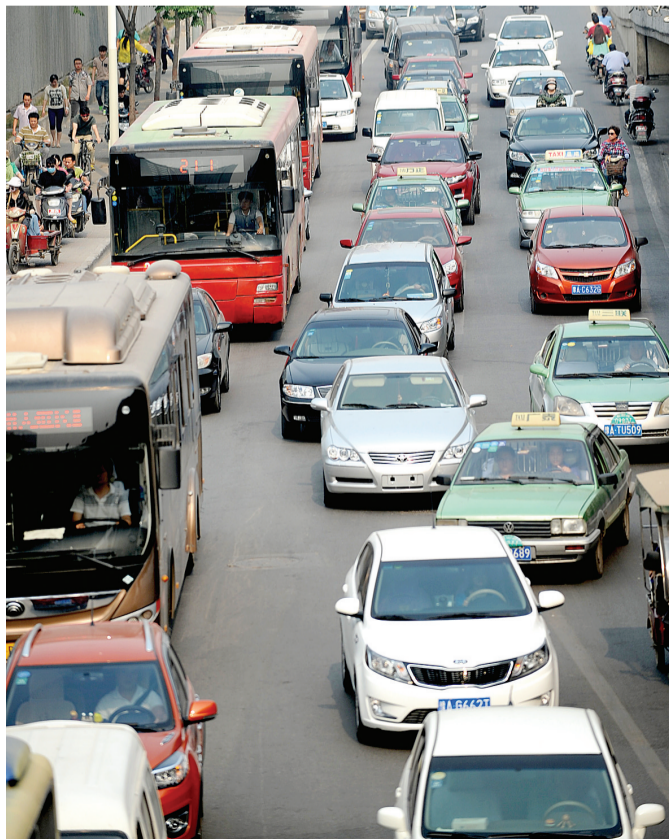
看看公交车在哪个位置。看看行人和自行车去了哪里。看看哪条道才是正道。大家说,这幅图里缺少了什么?

如何消除堵在市民心中的这个难题?请大家积极建言献策。我们的热线96678等着你。