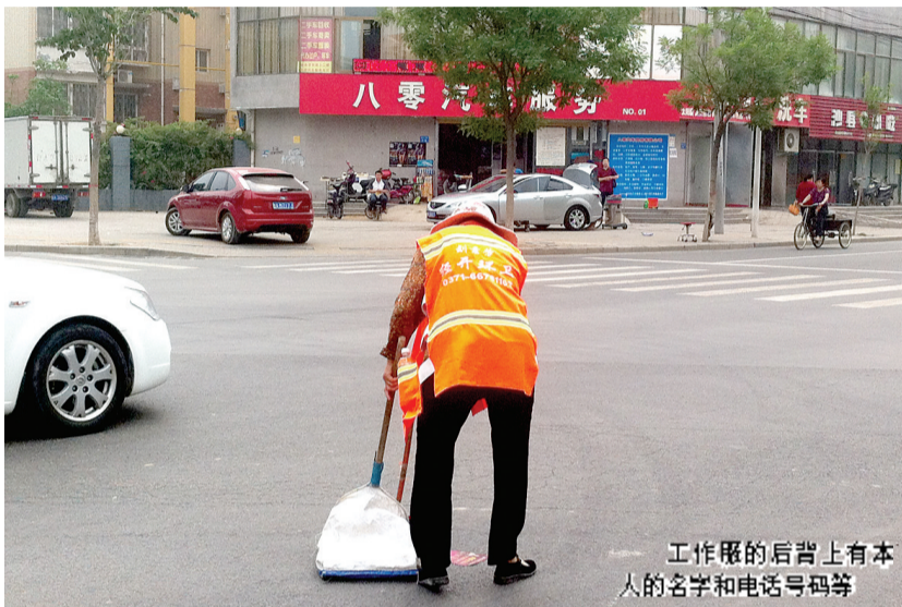
工作服的后背上有本人的名字和电话号码等