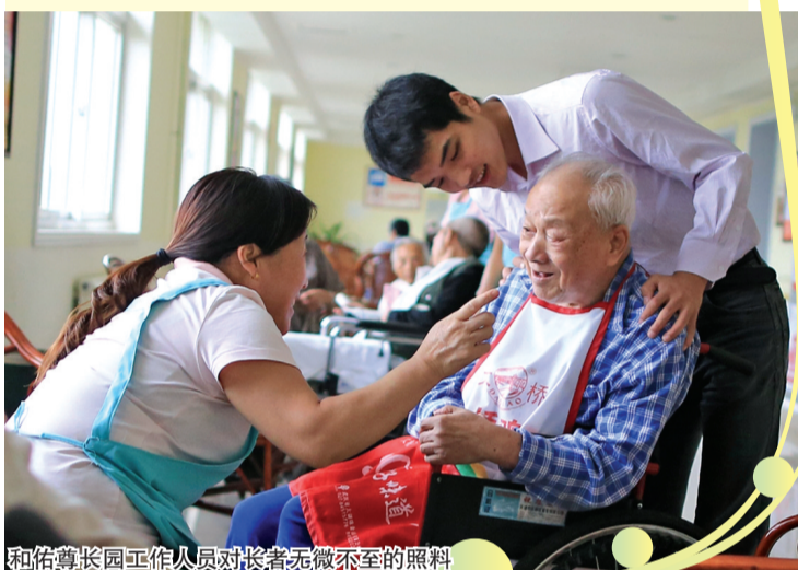
和佑尊长园工作人员对长者无微不至的照料