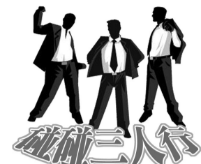
总第 196 期