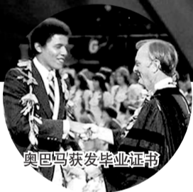
奥巴马获发毕业证书