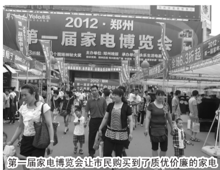
第一届家电博览会市民购买到了质优价廉的家电

2013年郑州第二届家电博览会在永乐郑州16家门店正如火如荼地进行,不少市民纷纷赶来享受永乐电器精心准备的一道丰厚大餐,现节能补贴已进入最后的冲刺收官阶段,各大品牌纷纷亮出自己的杀手锏,最后这3天“特惠假日”绝对不会辜负来参加展会的市民所期望。