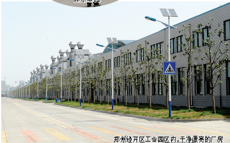
郑州经开区工业园区内，干净整洁的厂房