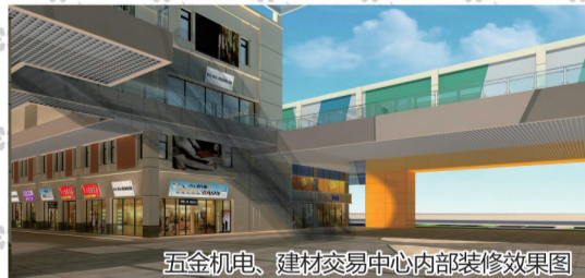
五金机电、建材交易中心内部装修效果图