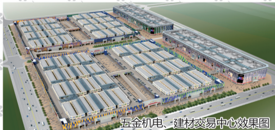
五金机电、建材交易中心效果图

华南城集团是香港上市公司（1668HK），是中国“综合商贸物流中心”的规划、建设和运营的领航者，具有无与伦比的品牌实力和先进的经营理念，10年七城的商贸物流运营经验，更使其他市场难以望其项背。