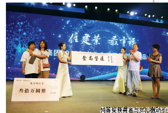
特等奖获得者与女儿激动拥抱