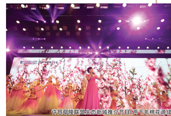
许昌鄢陵联盟生态新城推介节目《两千年桃花源续》