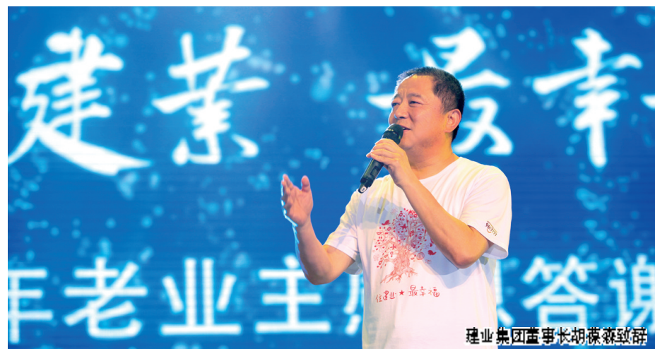
建业集团董事长胡葆森致辞