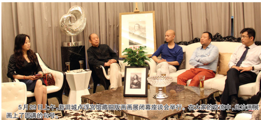
5月29日上午,新田城卢浮宫馆藏铜版画展闭幕座谈会举行。在大家的交流中,此次画展画上了圆满的句号。