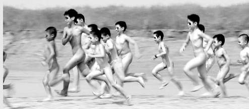
裸奔(筹得孤老院基金:3万元)

影片的内容质朴而生活化,但又充满创作的张力,场景丰富多变。电影中,像二七广场、人民公园、河南美术馆、邙山等咱郑州这些标志性地方,相信郑州市民可以一眼就认出来,而那些中小学校、小街道、小巷,以及路边的修车摊,都会让你充满亲切感,仿佛片中的角色就在你身边。还有大家不太熟悉的柿园小区,电影也全景式地展示了充满生活气息的城中村场景。