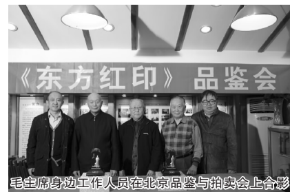
毛主席身边工作人员在北京品鉴与拍卖会上合影

广东的高总看到这尊主席宝玺,无比敬仰之情完全流露:早就想请个主席全身金像了,一直没有遇到这么尊贵吉祥的!毛主席全身金像高瞻远瞩,运筹帷幄,文韬武略的光辉形象和领袖的豪迈风范如在眼前,放在家里和办公室,心灵无比震撼,谁见谁喜欢!