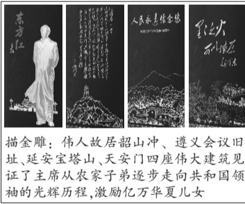
描金雕:伟人故居韶山冲、遵义会议旧址、延安宝塔山、天安门四座伟大建筑见证了主席从农家子弟逐步走向共和国领袖的光辉历程,激励亿万华夏儿女