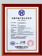
中国第一张变频空调节能认证证书