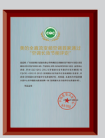
中国首家通过变频空调长效节能评定