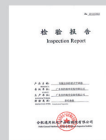
合肥通用机电产品检测院有限公司检测报告