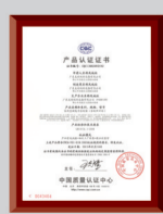
中国首家通过变频空调软件评估认证