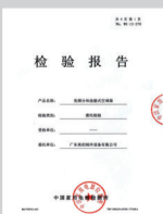
中国家用电器检测所检测报告

认证；2012年，美的全直流变频空调35KE(2)成为国内首款通过空调长效节能评定产品；2013年，美的全直流变频空调尚弧挂机26KB(1)成为空调行业首个通过国家“软件评估认证”的产品。