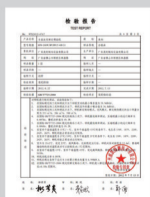
广州威凯检测技术有限公司检测报告