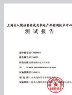
上海出入境检验检疫局机电产品检测技术中心检测报告