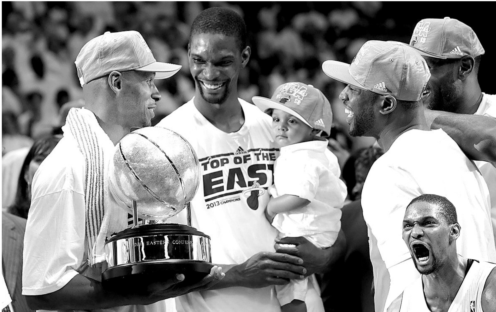
热火四巨头领取冠军奖杯