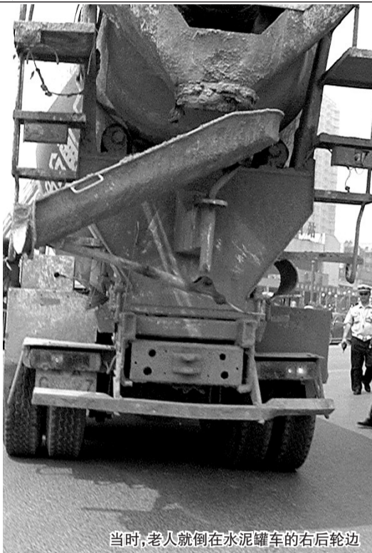
当时,老人就倒在水泥罐车的右后轮边