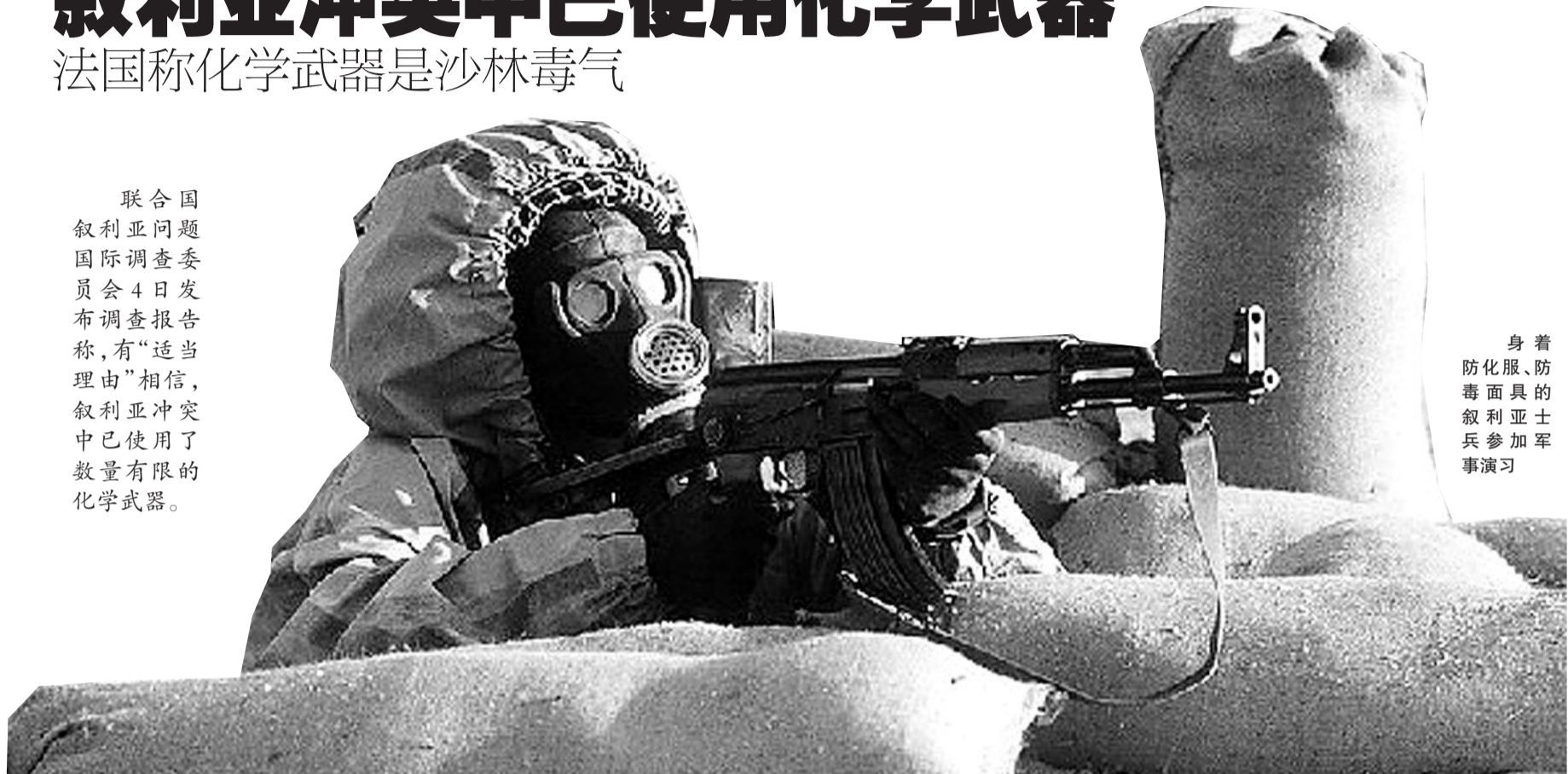
身着防化服、防毒面具的叙利亚士兵参加军事演习

联合国叙利亚问题国际调查委员会4日发布调查报告称,有“适当理由”相信,叙利亚冲突中已使用了数量有限的化学武器。