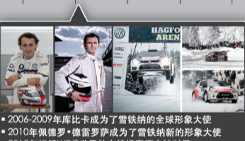
2006-2009年库比卡成为了雪铁纳的全球形象大使 2010年佩德罗·德雷罗萨成为了雪铁纳的形象大使 2013年担任WRC世界拉力锦标赛官方计时器