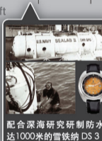
配合深海研究研制防水达1000米的雪铁纳DS3