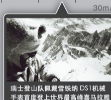
瑞士登山队佩戴雪铁纳DS1机械手表首度登上世界最高峰喜马拉雅

1960 登山 1970 入海 1970 力量 1995-2005 速度 2005 可靠和值得信赖 2006-2013 运动魅力