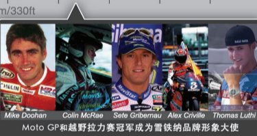
Mike Doohan Colin McRae Sete Gibernau Alex Criville Thomas Luhr Moto GP和越野拉力赛冠军成为雪铁纳品牌形象大使