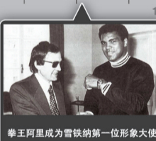
拳王阿里成为雪铁纳第一位形象大使