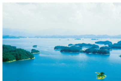
千岛湖-钱塘江的源头