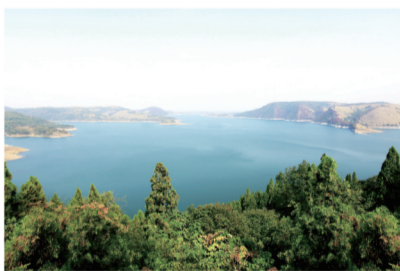
丹江口-南水北调源头