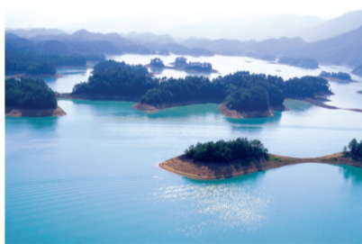
万绿湖-珠江的源头