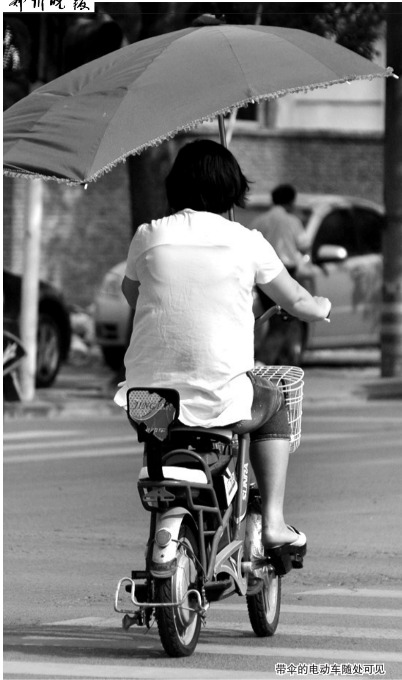
带伞的电动车随处可见