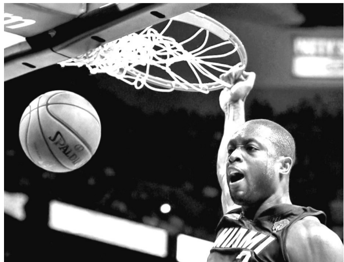
韦德 32分、6个篮板和6次抢断