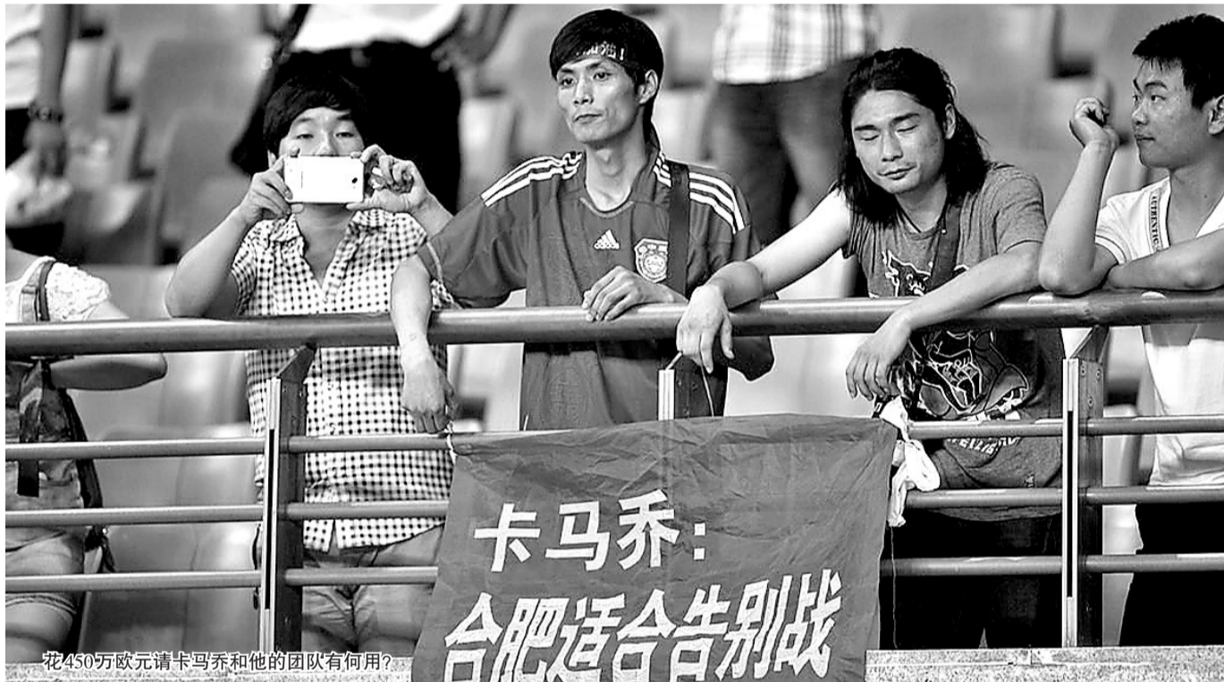
花450万欧元请卡马乔和他的团队有何用?

关东散人(话剧演员,喜剧表演艺术家李默然之子)给我留言:恒大的野心就是不断为中国体育培育教练。已经有了一个郎平,接下来可能是里皮。许家印在教导中国国家体育总局:你们不行,爷给你玩儿一个。爷玩儿什么什么行!结果是:十年左右,国家体育总局解散,恒大承担训练国家体育队任务。(顺便了解一下,世界上很少有哪个国家还设立个体育部。)