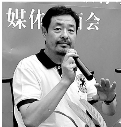
记者近距离采访濮存昕