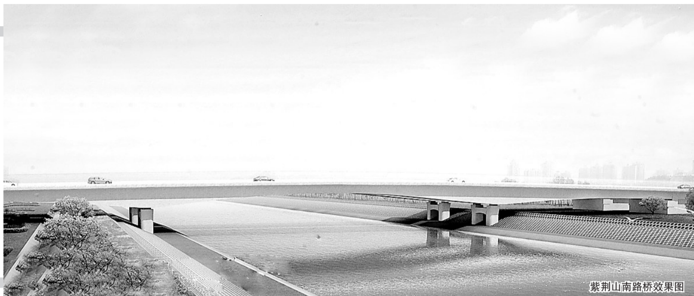
紫荆山南路桥效果图